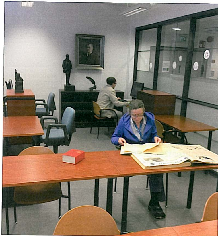
Päivälehdten arkiston tutkijasalissa kävi vuodessa noin 700 tutkijaa.

Pekalla ei kapinavaihtetta ollut vaan opinnot maistuivat. Eipä poika arvannut, että Aatos Erkon johta-