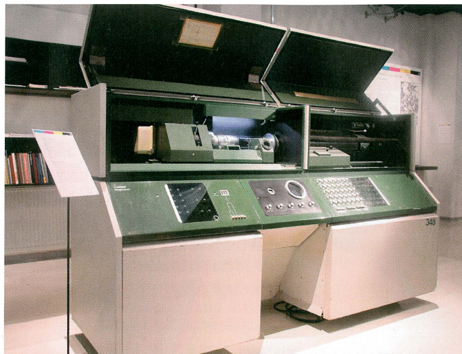
Näyttelyssä on esillä Sanomien siviilipainossa käytössä ollut kolmannen sukupolven rumpuskanneri MagnaScan.

Parkanossa ilmestyyvä Ylä-Satakunta -lehti hankkii Anygraafin levikki- ja jakelujärjestelmän CProfitin. Käyttöönotto tapahtuu alkuvuodesta 2012. Lehdessä on ennestään käytössä Anygraafin Doris-toimitusjärjestelmä sekä AProfit-ilmoitusjärjestelmä.