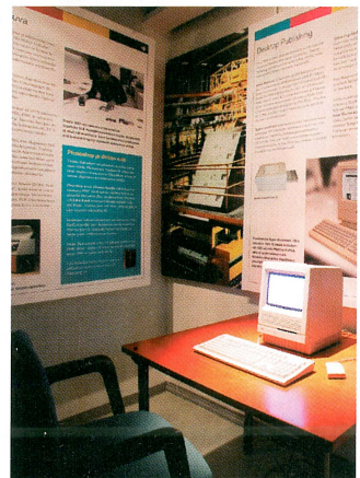
Museovieraat voivat testata miten Applen "kottaraispönttö-Mac" ja 1980-luvun PageMaker toimivat.