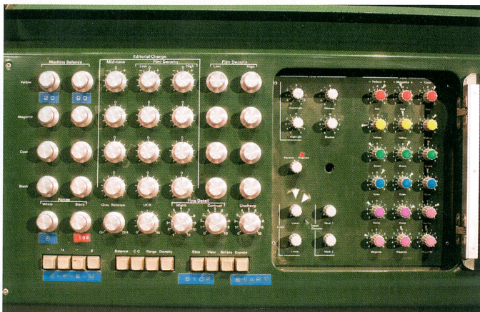
MagnaScanin ohjauspaneeli näyttää tältä.